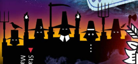
▼ Staking in Marmwaria